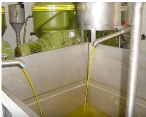
5. Βγαίνει το λάδι.