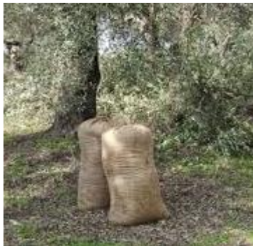
3. Βάζω τις ελιές σε σακιά.