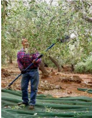
1. Ραβδίζω τα κλαδιά.