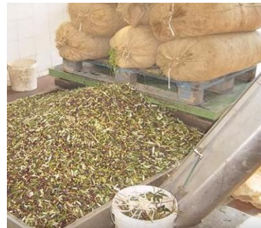
4. Πηγαίνω τα σακιά στο ελαιοτριβείο.